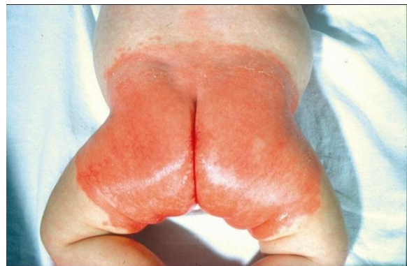
Abbildung 6-9: Irritative Kontaktdermatitis: Windeldermatitis