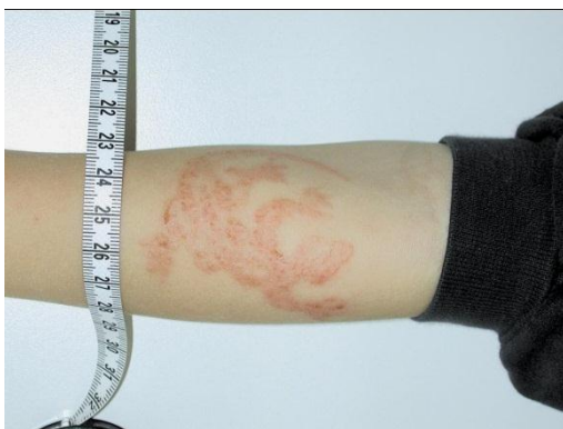
Abbildung 6-8: Allergisches Kontaktekzem auf ein Henna-Tattoo

Die häufigsten Auslöser von Kontaktallergien (= Kontaktallergene) bei Kindern sind in → Tabelle 6-3 aufgeführt. Der bedeutendste Auslöser ist weiterhin Nickel. Zunehmend häufiger werden Kontaktallergien auf Henna-Tattoos zum Problem ( siehe → Abbildung 6-8 ). Der Allergieauslöser ist hierbei nicht Henna selbst, sondern das zur Steigerung der Farbintensität und Haltbarkeit zugesetzte Paraphenyldiamin (PPD). Bei Erwachsenen spielen berufsbezogene Stoffe eine große Rolle.