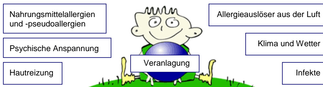
Abbildung 6-6: Ursachen der Neurodermitis

Seien Sie prinzipiell misstrauisch gegenüber jemandem der behauptet, er habe "die" Ursache der Neurodermitis gefunden und könne sie mit seiner Methode schnell und dauerhaft heilen.