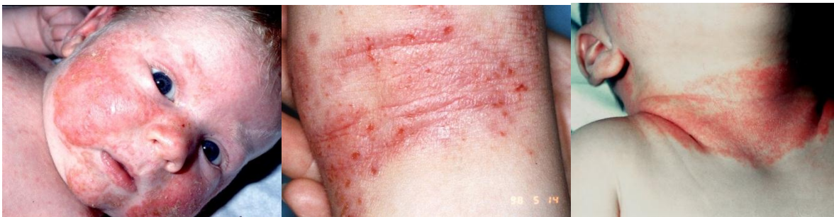
Neurodermitis im Gesicht

Der rote, schuppige, zum Teil verkrustete Ausschlag im Gesichts- und Kopfbereich wird auch Milchschorf genannt. Man kann daraus allerdings nicht automatisch auf eine Milchunverträglichkeit schließen. Eine nur im behaarten Kopfbereich bestehende Schuppung wird als Gneis bezeichnet und hat keinen Zusammenhang mit einer Neurodermitis.