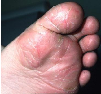
Abbildung 6-4: Atopische Winterfüße

Bei Schulkindern können auch isoliert die Füße betroffen sein. Die Haut ist schuppig und rissig, zwischen den Zehen auch nässend und wird häufig mit einem Fußpilz verwechselt. Da die Erscheinungen an den Füßen durch das geschlossene Schuhwerk im Winter am ausgeprägtesten sind, spricht man auch von "atopischen Winterfüßen" (siehe →Abbildung 6-4).