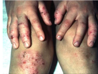
Abbildung 6-5: Superinfektion